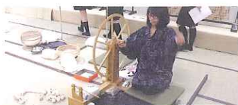
喜如嘉の芭蕉布「芭蕉の燃り掛け」

実演コーナーではそれぞれの産地の職人による沖縄の自然・文化の中で受け継がれてきた手技を間近でご覧いただけます。