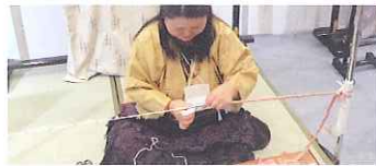
久米島紬「餅くくり」