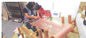
琉球餅「種糸取り、くくり」