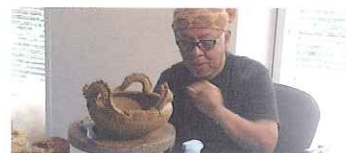
壺屋焼「龍巻壺・シーサー製作」