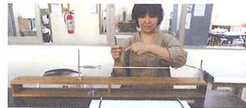
八重山上布「餅つくり(捺染と括り)」