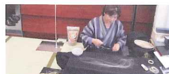
宮古上布「苧麻績み」